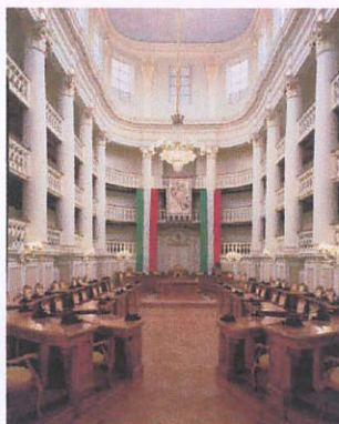
Sala del Tricolore